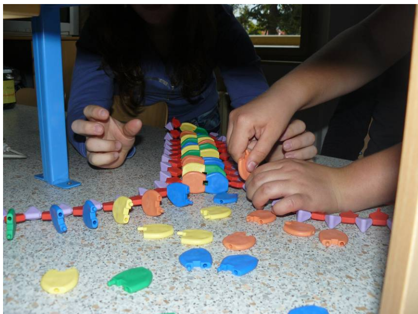
Obrázek 2 transkripce mRNA