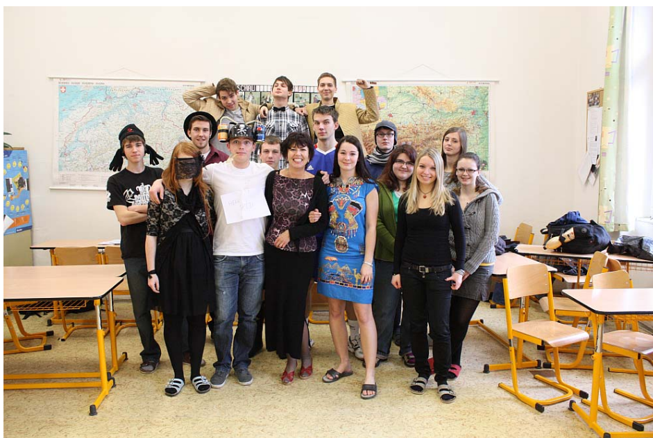
Obrázek 4 Modenschau – módní přehlídka v hodinách německého jazyka

Výuka předmětu německý je na dobré úrovni. Předměty vyučují plně aprobovaní učitelé. Vyučující se snaží výuku co možná nejvíce oživit, vyučují podle nejmodernějších učebnic, výuku doplňují širokou škálou dalších učebních materiálů. Studenti se účastní poznávacích zájezdů a pracují na školních projektech. Studenti se zapojují i do mimoškolních akcí, pravidelně se účastní seminářů v Bad Marienberg–Europahaus, dále akcí Goethe–Institutu Prag. Škola spolupracuje s družebním gymnáziem v Günzburgu, pravidelně dochází k výměnám studentů. Škola uvažuje do budoucna o dalším bilaterálním projektu v rámci programu Comenius, který byl z jazykového, sociálního a poznávacího hlediska velmi přínosný. Podmínky pro studium jazyka jsou vyhovující.