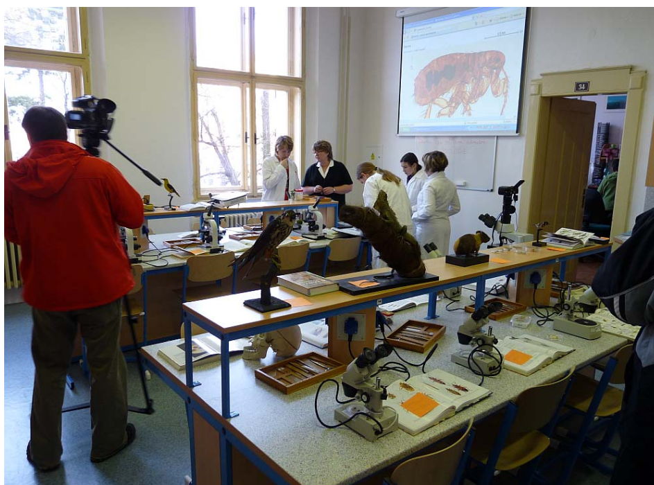
Obrázek 1 Nová laboratoř biologie – projekt experiment

Ve škole je chemická laboratoř, nově zrekonstruovaná biologická laboratoř, dvě učebny výpočetní techniky s internetem, který sponzoruje firma KLFREE NET (bylo ukončeno sponzorství s firmou Beránek), specializované učebny fyziky, chemie, biologie, hudební výchovy a výtvarné výchovy. Součástí výukových prostor je audiovizuální přednášková místnost pro 68 studentů. Tato učebna je plně využívána jako přednášková místnost a pro spolupráci s jinými organizacemi. Učebna biologie je vybavena projektovým plátnem, data projektorem, stereoskopickou lampou s možností mikrofotografie a prezentace, počítačem se síťovým připojením, videem a ozvučením, demonstračním mikroskopem. Učebna fyziky v současné době plně vyhovuje moderním podmínkám výuky pro výuku fyziky. Z projektu „Experimentem k hlubšímu poznání“ z OPVK byla doplněna laboratoř fyziky, laboratoř chemie laboratoř biologie pomůckami pro další prohlubování poznání. Interaktivní učebna přírodovědných předmětů je vybavena interaktivní tabulí a dataprojektorem. Tato učebna se využívá pro výuku fyziky, chemie a zeměpisu. Interaktivní tabule v učebně pro anglický jazyk je plně využívána. V rámci projektu „Modernizace škol Středočeského kraje byla vybudována učebna pro výuku českého jazyka a základů společenských věd, s interaktivní tabulí, dataprojektorem, DVD