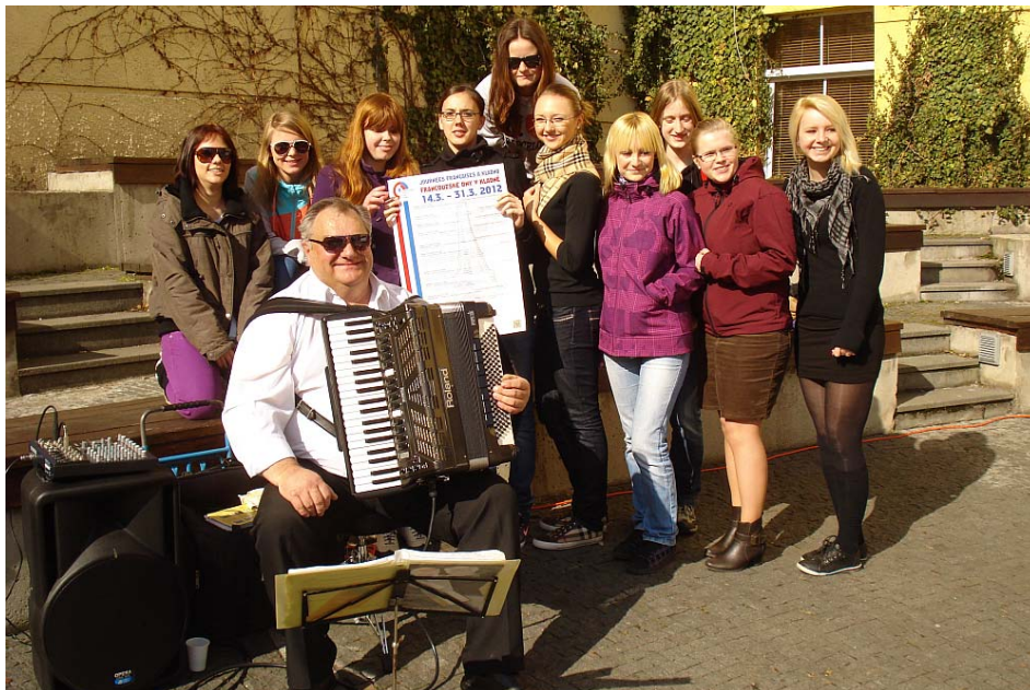
Obrázek 6 Francouzsko–české dny

S výukou předmětu Francouzský jazyk studenti začínají v primě a pokračují až do kvarty ve 2 hodinové dotaci týdně. Na vyšším stupni gymnázia mají studenti v prvním a druhém ročníku čtyřhodinovou dotaci týdně, ve třetím a čtvrtém ročníku pak tříhodinovou dotaci týdně.