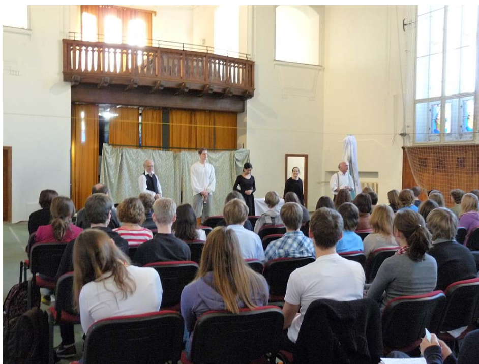
Obrázek 3 Netradiční výuka angličtiny – divadlo

Výuka angličtiny probíhá ve skupinách utvořených na základě prokázaných jazykových znalostí studentů a míry jejich schopnosti tyto znalosti aktivně použít. V předmětové komisi pracují tři rodilí mluvčí, kteří učí nejen v seminářích, ale i v některých běžných hodinách.