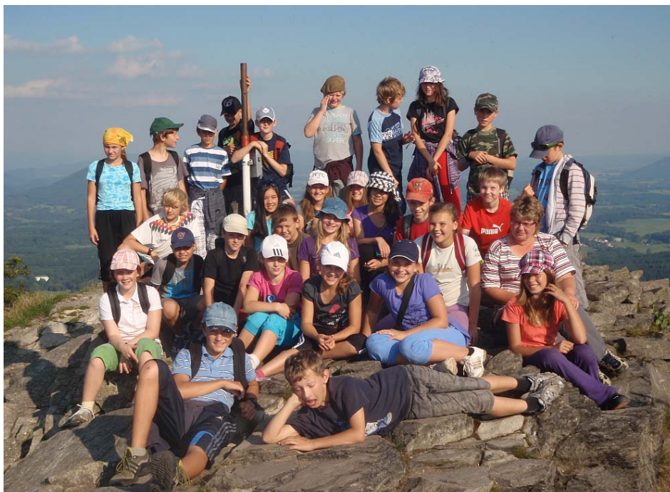
Obrázek 8 Adaptační kurz – prima na Klíči