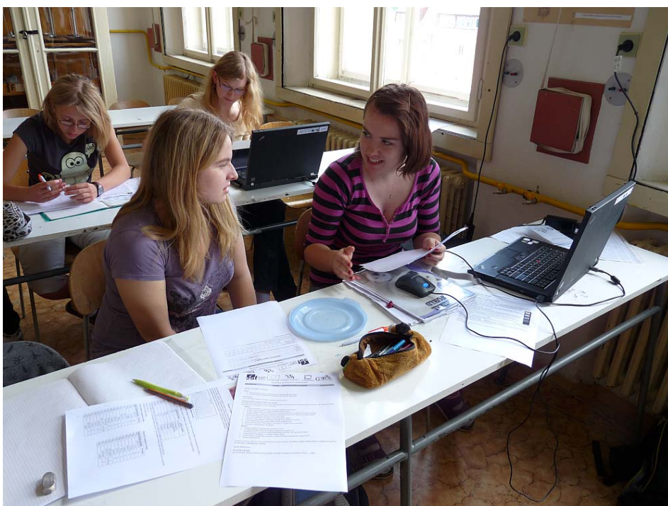
Obrázek 2 Žáci v učebně fyziky při práci s novými notebooky

Pro prezentaci školy (slavnostní vyřazení studentů, vánoční koncert aj. je ozvučena aula školy, do které lze umístit stohovatelné židle pro lepší manipulaci a estetickou úroveň auly. V učebnách se postupně nahrazují dřevěné tabule za keramické pojízdné tabule. V době hlavních prázdnin proběhla výměna osvětlení ve čtyřech učebnách a výměna podlahových krytin v učebnách, ve kterých již podlahová krytina nevyhovovala užívání (bezpečnost) – financovalo Město Kladno. Počítačová učebna je vybavena 17 ti HP SFF počítači včetně základního softwarového vybavení. Vzhledem k náročnosti vybudování internetové sítě do některých učeben ve škole je ve škole pořízena Wifi technologie pro učebny 23, 42, 43, 55 a pro studovnu. Studenti tak mají možnost připojení k internetu prostřednictvím vlastních notebooků. Učebny 17 a 29 jsou připojeny do školní počítačové sítě novými rozvody. Ve škole je v současné době 16 dataprojektorů, z toho jsou dvě mobilní pracoviště pro použití na kurzech apod. Tři z těchto dataprojektorů jsou již zastaralé, a bude je nutno nahradit.