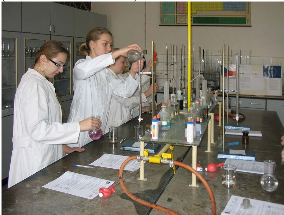
Obrázek 11 Chemická laboratoř – projekt Experiment