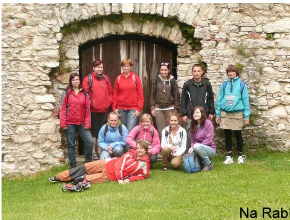
Obrázek 13 Tělovýchovný kurz – turisté

Lyžařské výcvikové kurzy proběhly tradičně ve Vebrových boudách v Peci pod Sněžkou, kurzů se zúčastnili žáci prvních ročníků čtyřletého studia, kvinta a tercie. Pro zájemce byl uspořádán lyžařský zájezd do Rakouska – středisko Gaissau – Hintersee