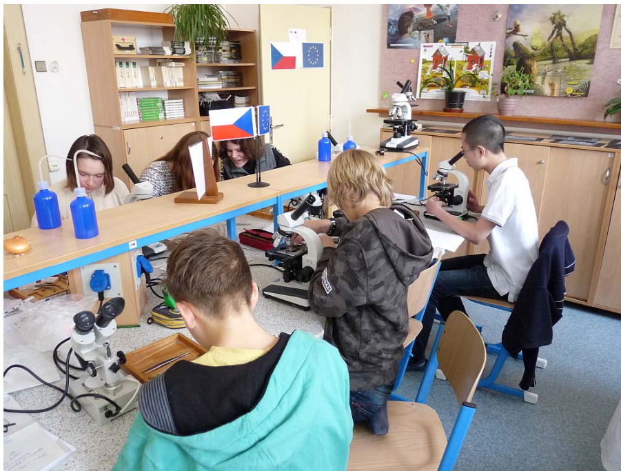
Obrázek 12 Seminář v biologické laboratoři

Máme nové zařízení biologické laboratoře, kde nyní může probíhat multimediálně výuka laboratorních cvičení, součástí laboratoře je možnost projekce přímo z mikroskopu či binokulární lupy, využití připojení k internetu, možnost práce s notebooky. Laboratoř je vybavena některými novými pomůckami. Dvě odborné pracovny a laboratoř jsou využívány dle rozvrhových možností. Vybavení uč. 35 je vyhovující, ale chtěli bychom je doplnit větší tabulí mimo osu promítání; č. 32 je třeba dovybavit kvalitnější projekční technikou, tak aby se ve