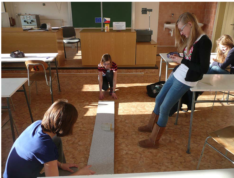
Obrázek 10 Prohlubující seminář v učebně fyziky

tohoto projektu byly pořízeny nové pomůcky, uskutečnily se prohlubující semináře pro nadané studenty, kteří se zajímají o fyziku, byly uspořádány dílny a prezentace zajímavých experimentů pro žáky ZŠ. Dále vyučující fyziky vypracovávali metodické listy. Letos poprvé proběhla výuka ve třetím ročníku podle vzdělávacího programu Albatros. Podle tohoto programu výuka fyziky ve třetím ročníku končí. Některé učivo bylo tedy přesunuto do dvouletého fyzikálního semináře.