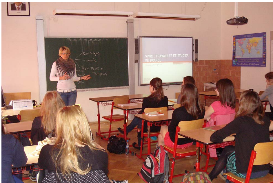
Obrázek 7 Francouzština v jazykové učebně 18

K frankofonní atmosféře přispívá také každoroční turnaj v pétanque , kdy se studenti naučí tradiční francouzskou hru.